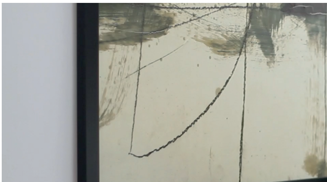
FOTOGRAMA DEL LARGOMETRAJE