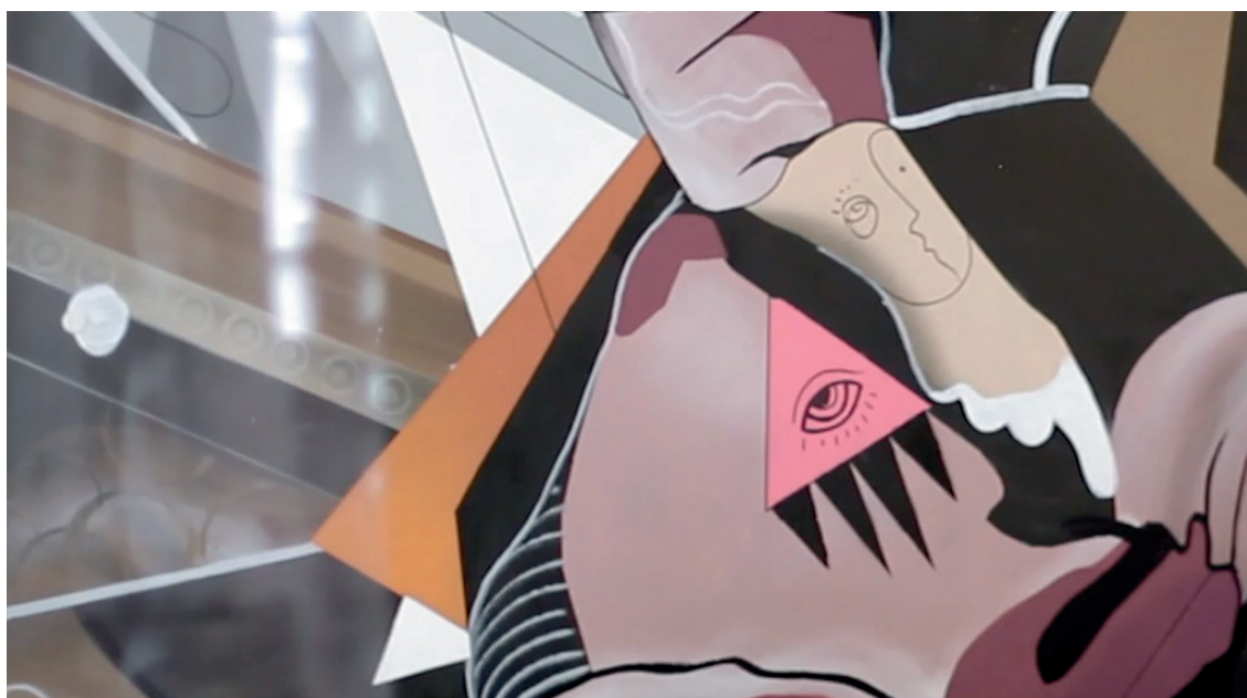
FOTOGRAMA DEL LARGOMETRAJE