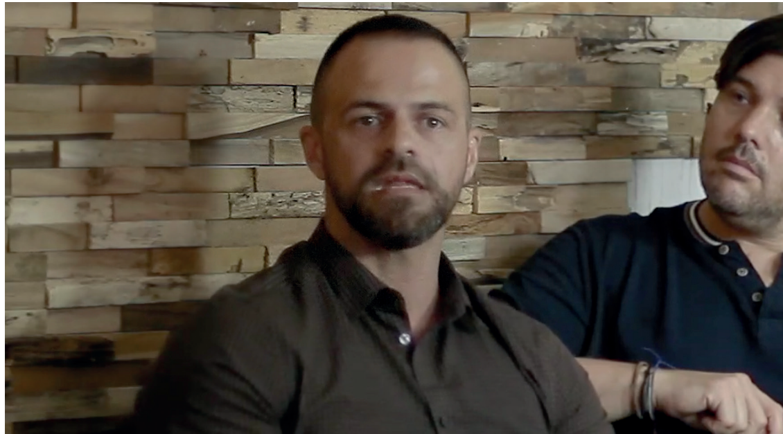
FOTOGRAMA DEL LARGOMETRAJE