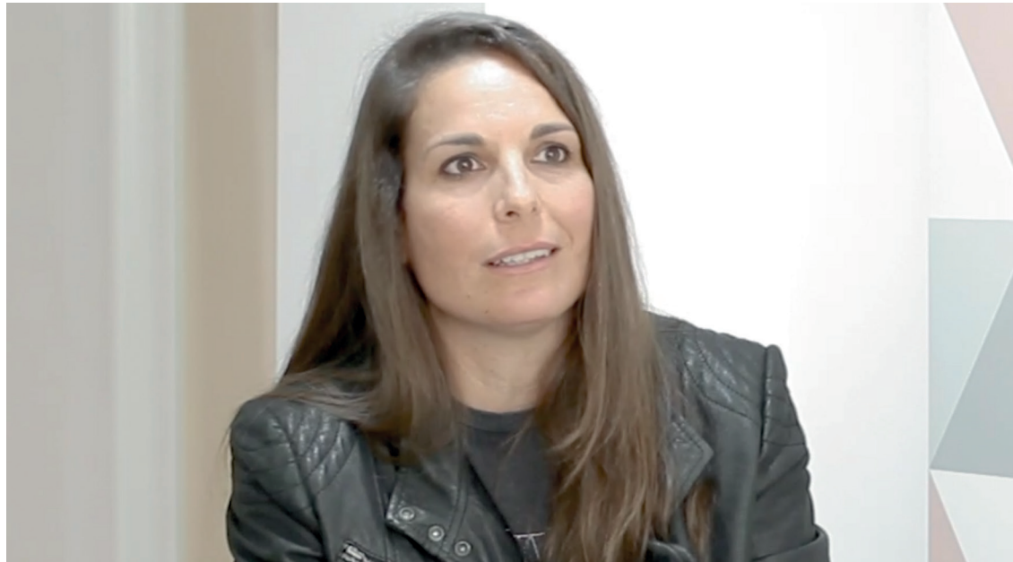
FOTOGRAMA DEL LARGOMETRAJE