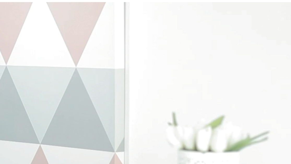
DANA CERVANTES | Atleta olímpica