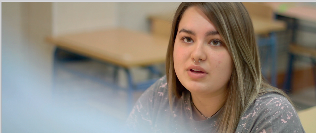
FOTOGRAMA DEL LARGOMETRAJE